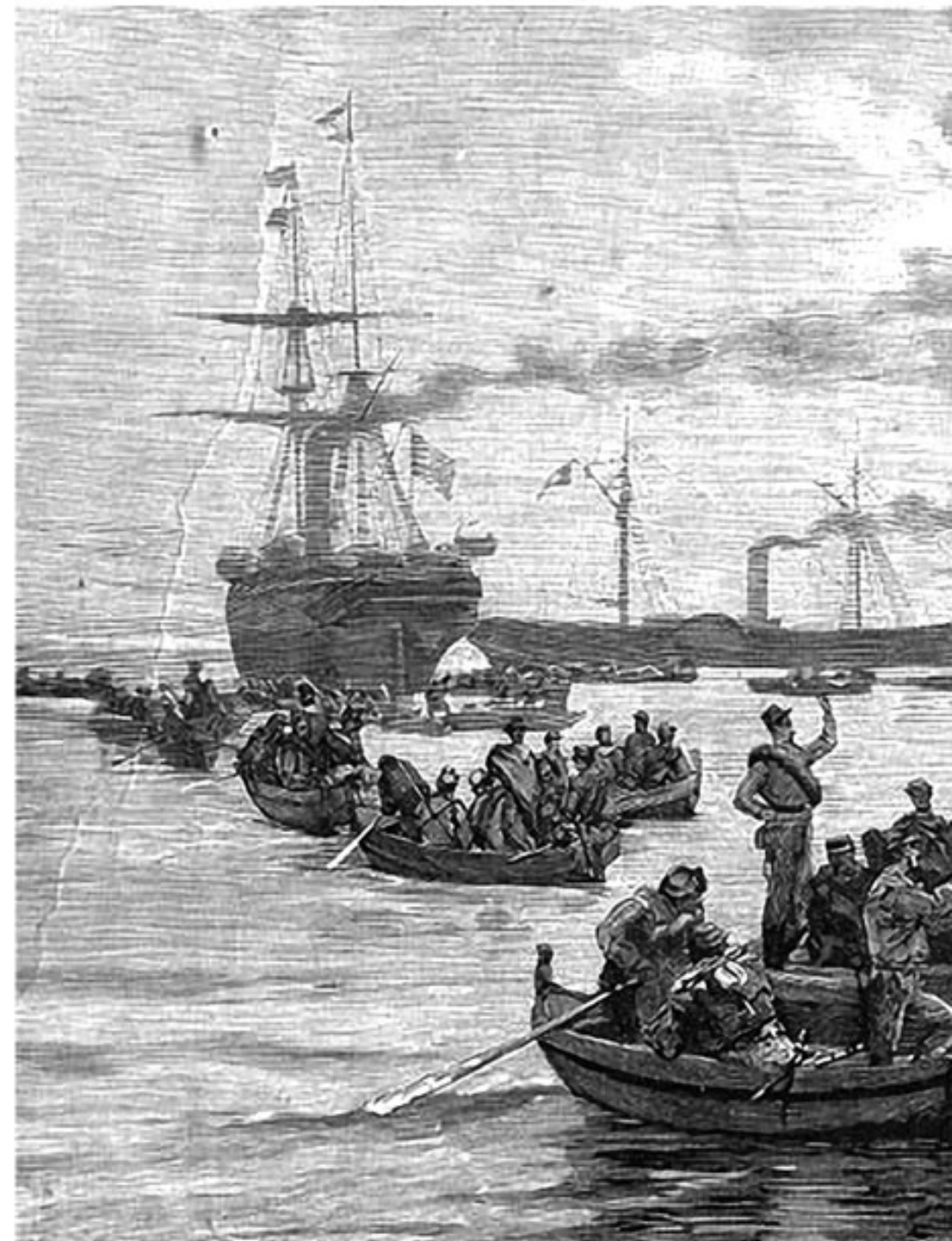
La partenza dei Mille da Quarto (Anonimo)

Lo sbarco dei Mille a Marsala; Anonimo. Lit. Rossetti. MI.